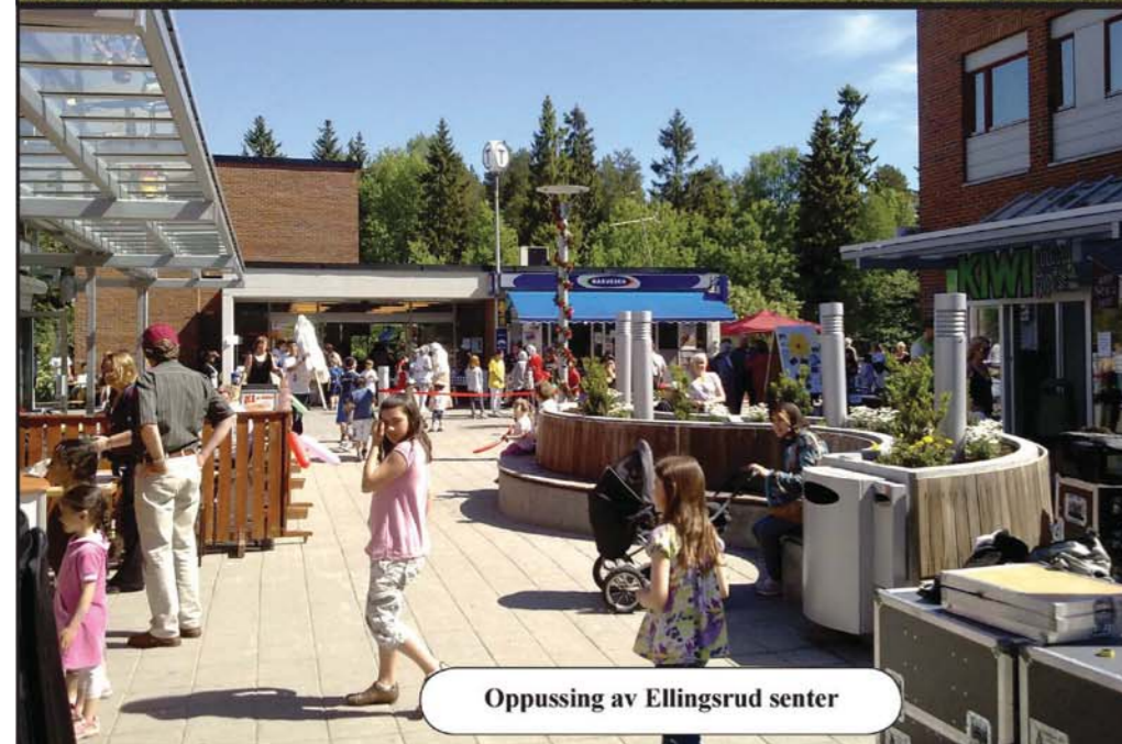
Oppussing av Ellingsrud senter