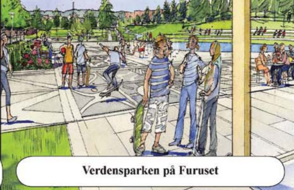
Verdensparken på Furuset