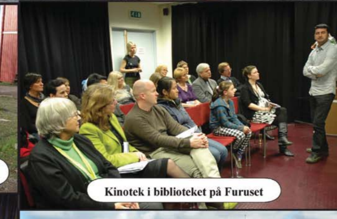
Kinotek i biblioteket på Furuset