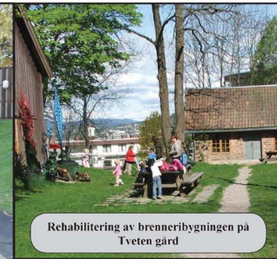
Rehabilitering av brenneribygningen på Tveten gård