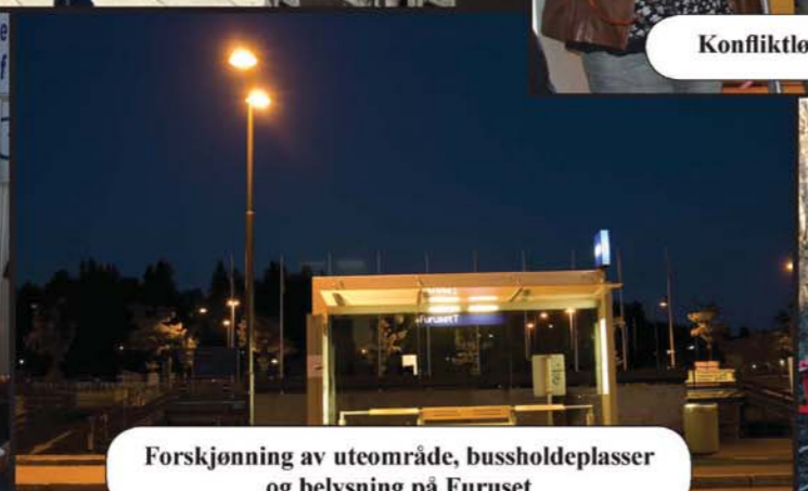
Forskjøning av uteområde, bussholdeplasser og belysning på Furuset