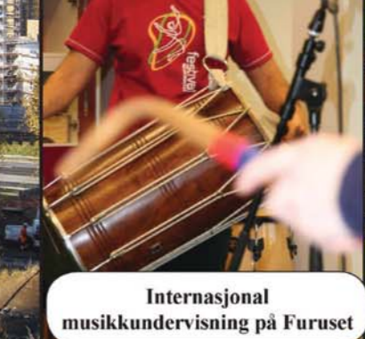
Internasjonal musikkundervisning på Furuset