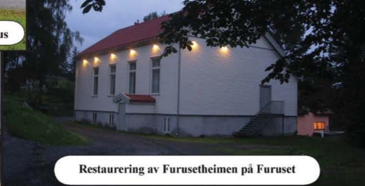
Restaurering av Furusetheimen på Furuset