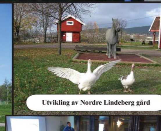
Utvikling av Nordre Lindeberg gård