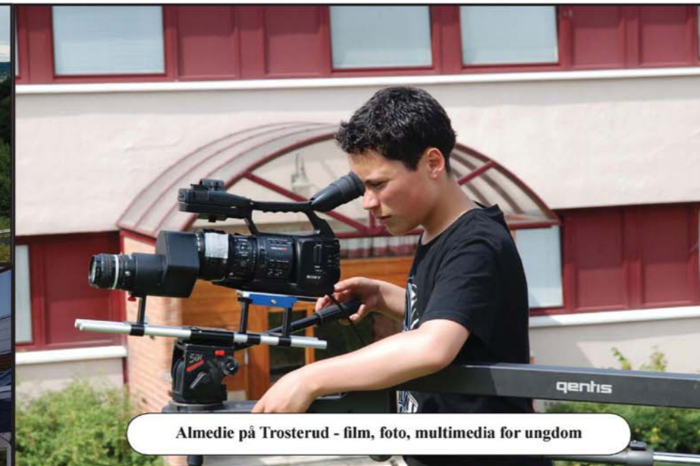
Almedie på Trosterud - film, foto, multimedia for ungdom