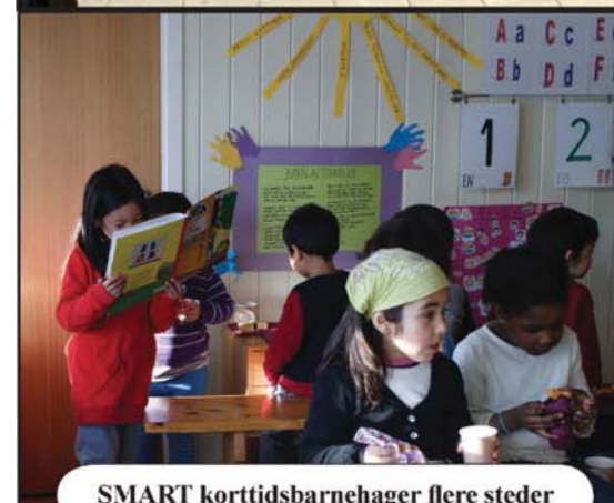
SMART korttidsbarnehager flere steder