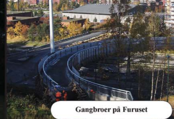
Gangbroer på Furuset