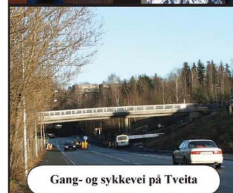
Gang- og sykkevei på Tveita