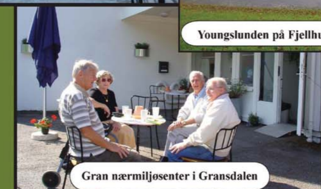
Gran nærmiljøsentere i Gransdalen