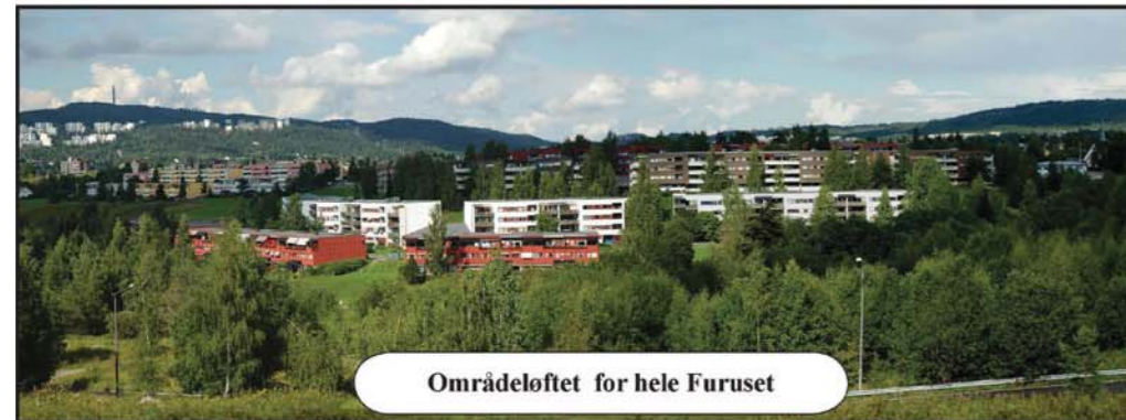
Områdeløftet for hele Furuset