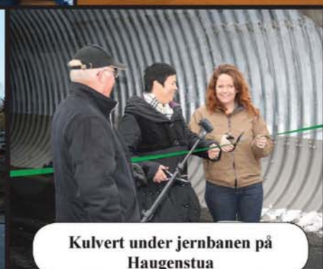
Kulvert under jernbanen på Haugenstua