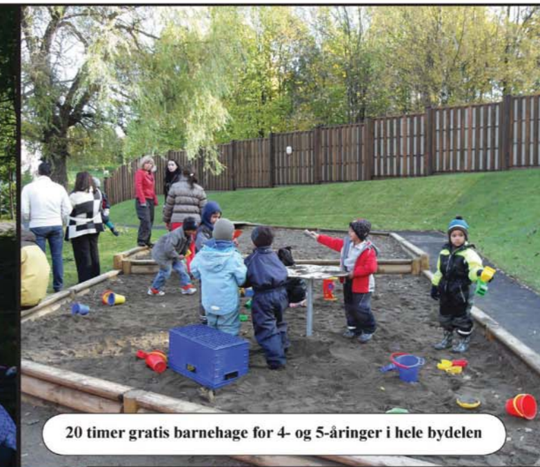
20 timer gratis barnehage for 4- og 5-åringere i hele bydelen