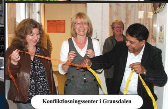
Konfliktløsningssenter i Gransdalen